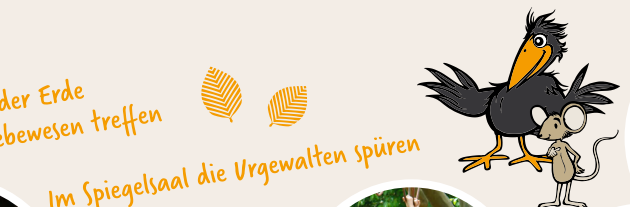
Unter der Erde das größte Lebewesen treffen