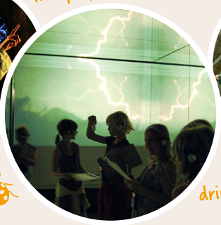
Draußen und drinnen gibt es für alle viel zu entdecken