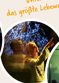
Im Spiegelsaal die Urgewalten spüren