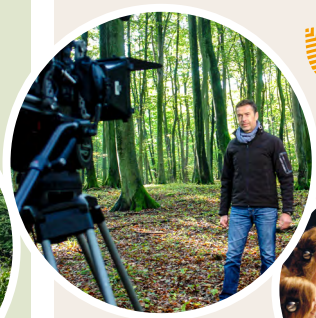
Multivisionskino mit dem Dirk Steffens-Film